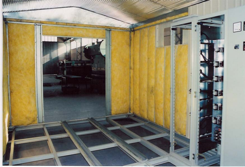
BİRİNCİ ETAP İzolasyonun yerleştirilmesi

Transformatör köşkünün imalat sırasında duvarlara izolasyonların konulması.