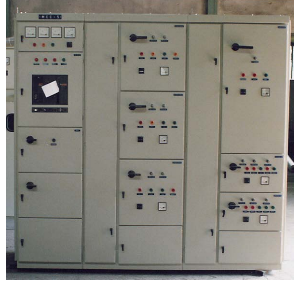
TIP D.2 FORM3b

IEC 60439-1 standartlarına uygun istenilen formda imalat yapılabilmektedir.