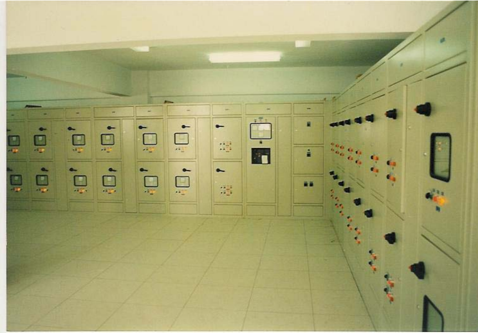
TİP D.2 FORM3b MCC PANOSU

MCC panoları motorların beslendiği kontrol ve kumanda merkezlerinde kullanılırlar. (Silolar, arıtma tesisleri, pompa istasyonları ve sanayi tesisleri).