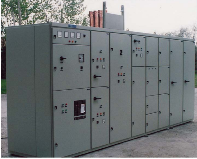
TIP D.2 FORM4a