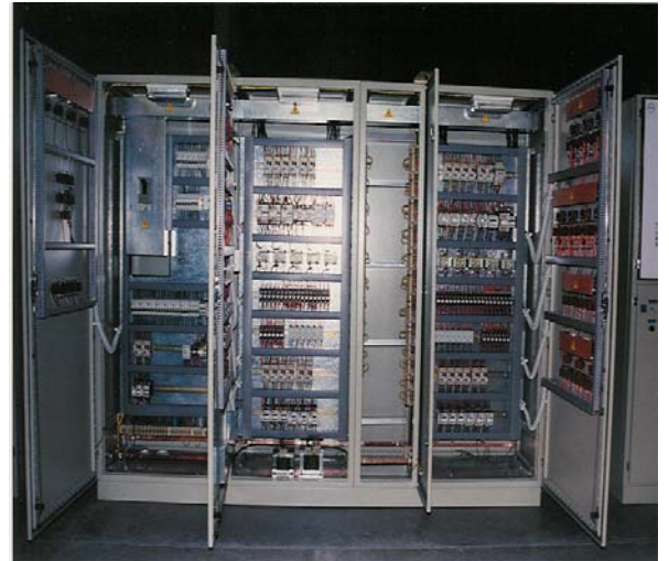
TIP D.2 FORM2a İÇ GÖRÜNÜŞ