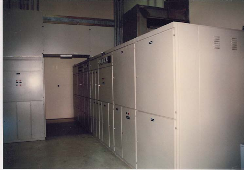
ANA DAĞITIM PANOSU VE BARA BESLEMESİ (5000A)

Temizleme işlemi yağ alma ve fosfat banyosu içerir. Temizleme işleminden sonra epoxy boya ile boyanan panolar 200°C de fırınlanır.