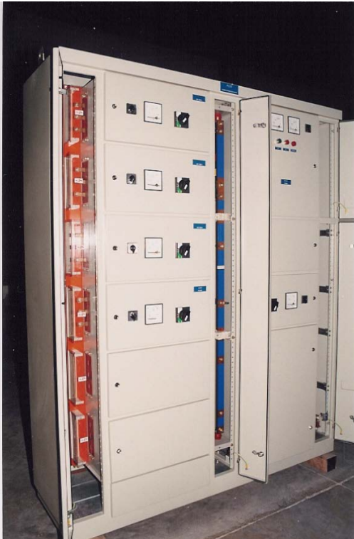
TIP 3B SEMERKAND TÛTÛN FABRİKASI ANA PANOSU