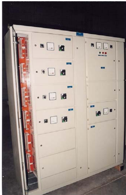
TİP 3B-IEC 439 ANA DAĞITIM PANOSU