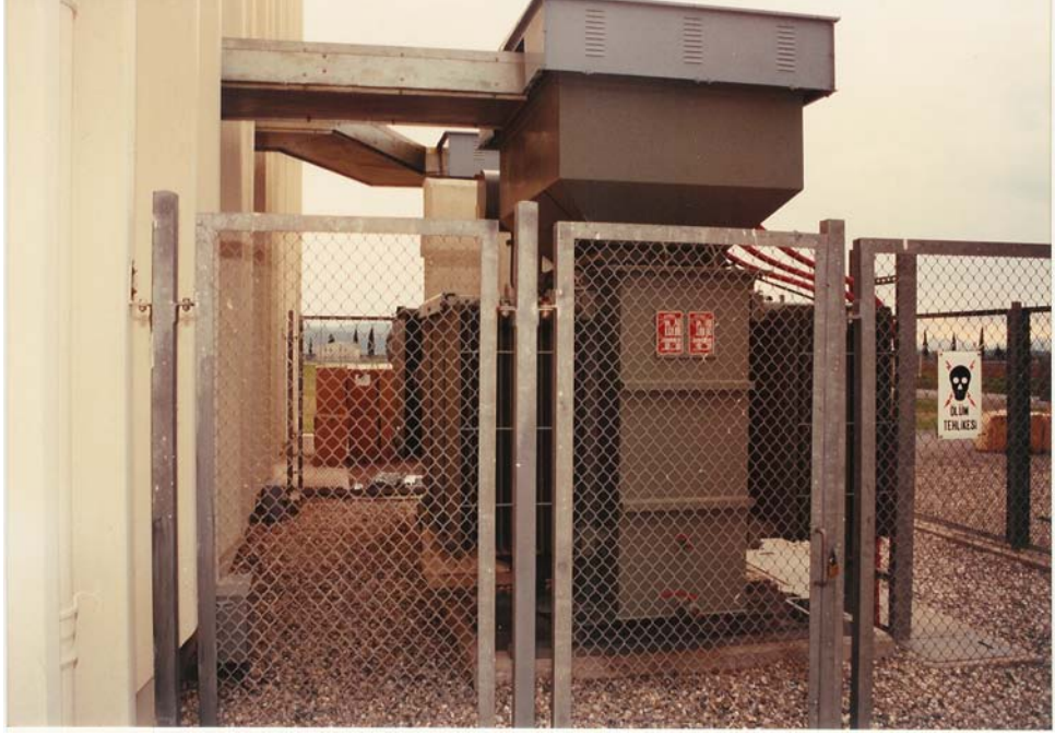
3250 KVA TRAFÖ VE 5000 A BARA SİSTEMİ

Trafo ile ana dağıtım panosu arasında kablo yerine kapalı tip bara sistemi kullanılmıştır. İki trafo arasındaki kablaj 5000 A lik bara ile yapılmıştır.