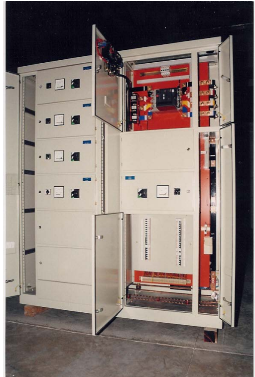
TIP 3B SEMERKAND TÛTÛN FABRİKASI ANA PANO İÇ GÖRÛNÛŞÛ